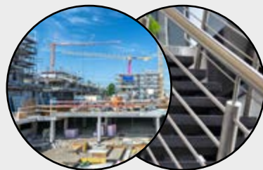
Bauindustrie und Geländerbau