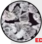
EDGE Selbstschärfendes Korn