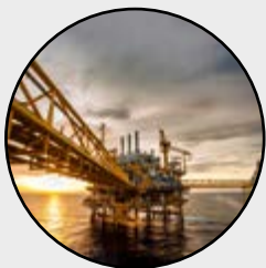
Öl und Gas Industrie